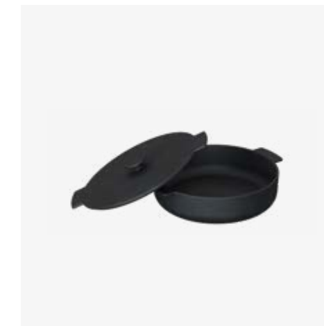
OFYR CAST IRON CASSEROLE 21