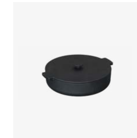
OFYR CAST IRON CASSEROLE 26