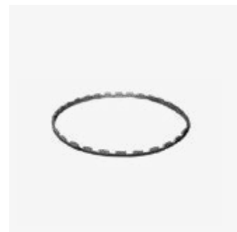
154 | Horizontal Skewers Ring