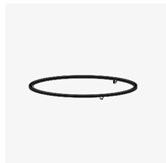
168 | Food Bumper