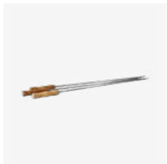
214 | Skewers