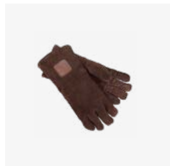
180 | Gloves Brown