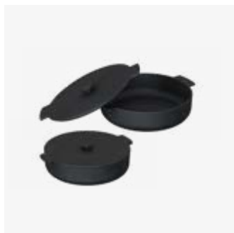
194 | Cast Iron Casserole Set 21 + 26