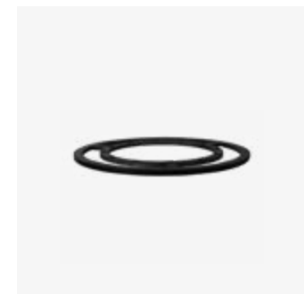
152 | Brazilian Grill Ring